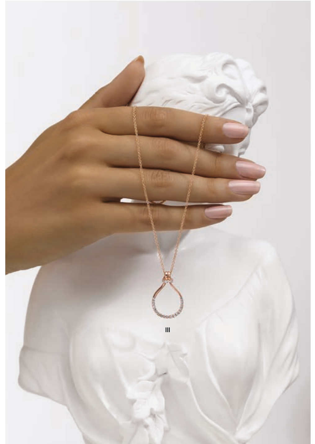
III. Collier - Diamants, or rose - 2 790 €