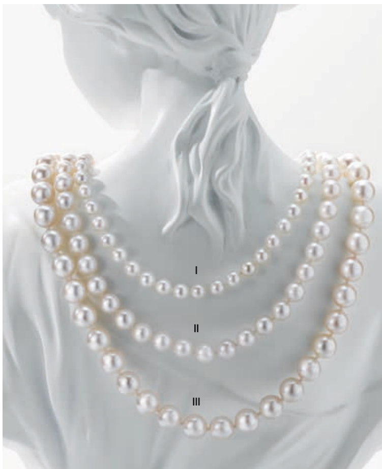
I. Collier - Perles de culture Akoya, fermoir or jaune - 995 € / II. Collier - Perles de culture Akoya, fermoir or jaune - 1 680 € III. Collier - Perles de culture Akoya, fermoir or jaune - 2 870 €