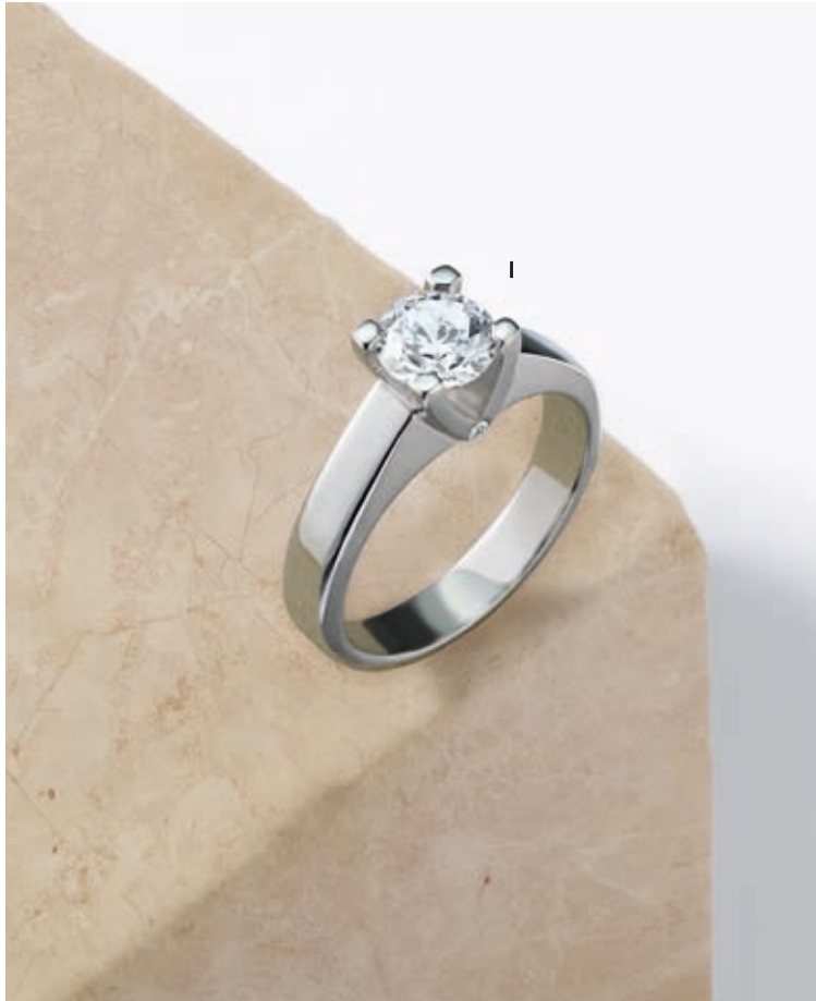
Ligne «Perspectives» en exclusivité pour Le Bijoutier des Créateurs I. Solitaire - Diamant, 1,00 carat, or blanc - Prix sur demande