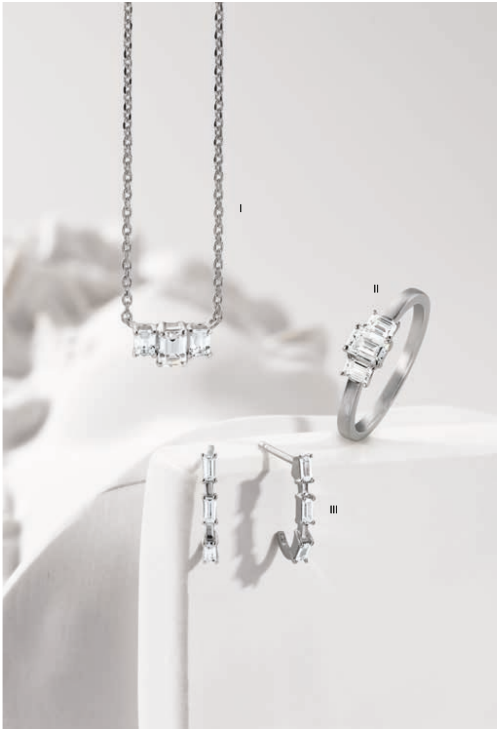
I. Collier - Diamants, or blanc - 3 650 € / II. Bague - Diamants, or blanc- 3 790 € III. Boucles d'oreilles - Diamants baguettes, or blanc- 1 095 €