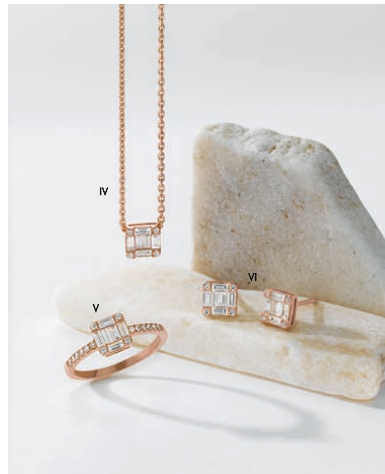
IV. Collier - Diamants, or rose - 1 840 € / V. Bague - Diamants, or rose - 1 830 € VI. Boucles d'oreilles - Diamants, or rose - 2 030 €