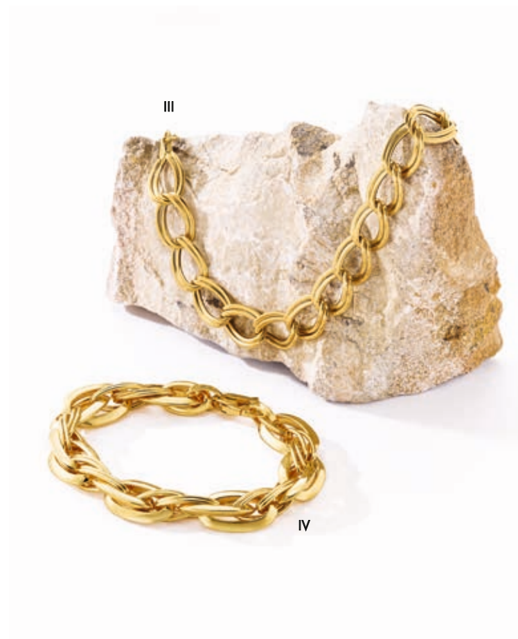
III. Bracelet - Or jaune - 860 €- Existe en collier / IV. Bracelet - Or jaune- 2 280 €