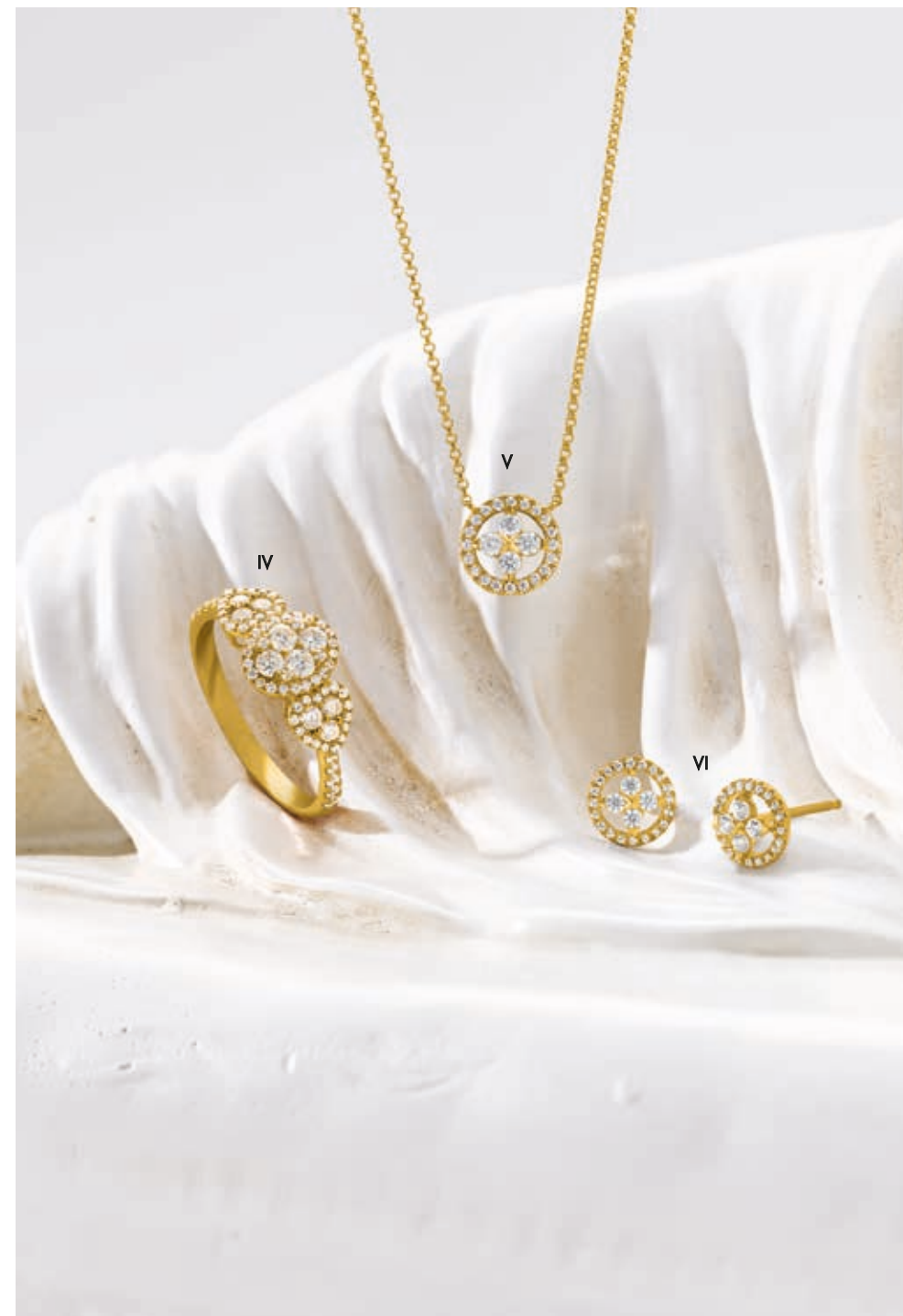
IV. Bague Vendôme Paris - Diamants, or jaune - 3 230 € V. Collier - Diamants, or jaune - 1 380 € / VI. Boucles d'oreilles - Diamants, or jaune - 1 350 €