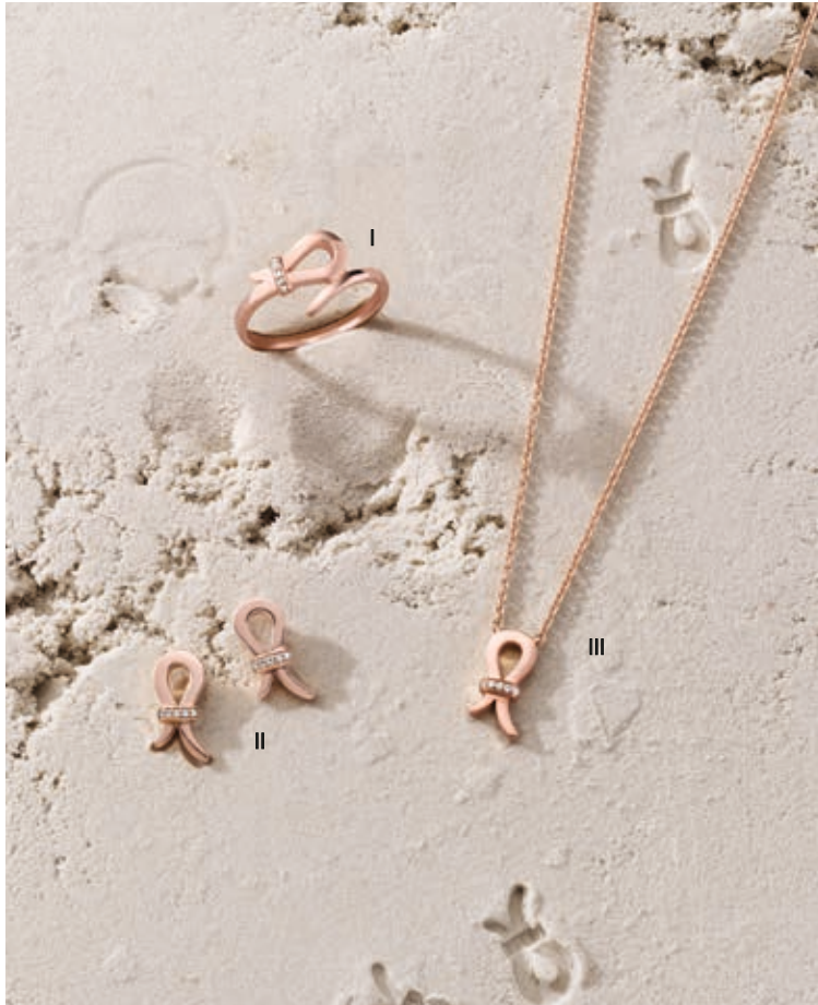
I. Bague - Diamants, or rose - 570 €/ II. Boucles d'oreilles - Diamants, or rose - 820 € III. Collier - Diamants, or rose - 730 €