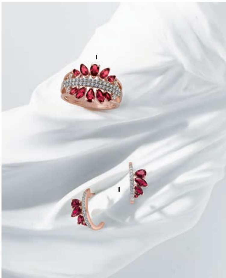
I. Bague - Diamants, rubis, or rose - 3 600 € / II. Boucles d'oreilles - Diamants, rubis, or rose - 1 500 €