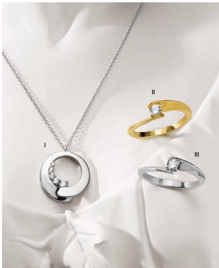
Gareil Paris - Ligne « Envol » I. Collier - Diamants, or blanc - 1 850 € / II. Bague - Diamant, or jaune - 1 790 € III. Bague - Diamant, or blanc - 1 450 €