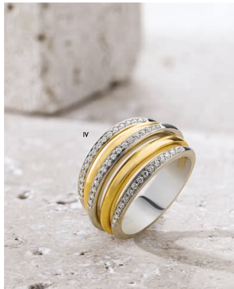
IV. Bague - Diamants, or jaune, or blanc - 2 700 €