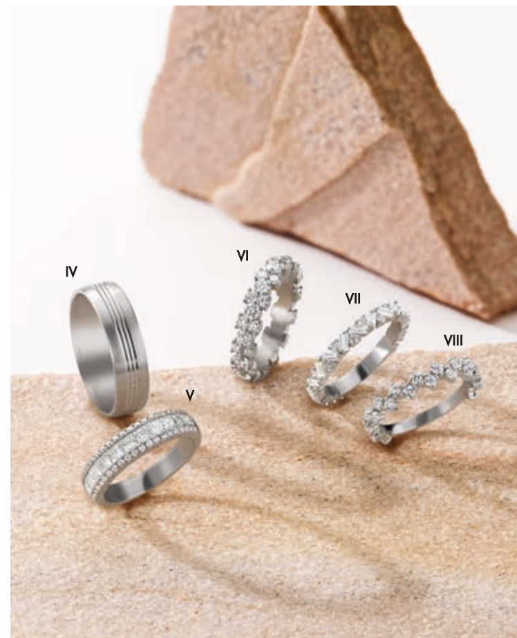
IV. Alliance - Or blanc - 1 100 € / V. Alliance - Diamants, or blanc - 4 350 € VI. Alliance - Diamants, or blanc - 5 500 € / VII. Alliance - Diamants, or blanc - 2 790 € / VIII. Alliance - Diamants, or blanc - 3 540 €