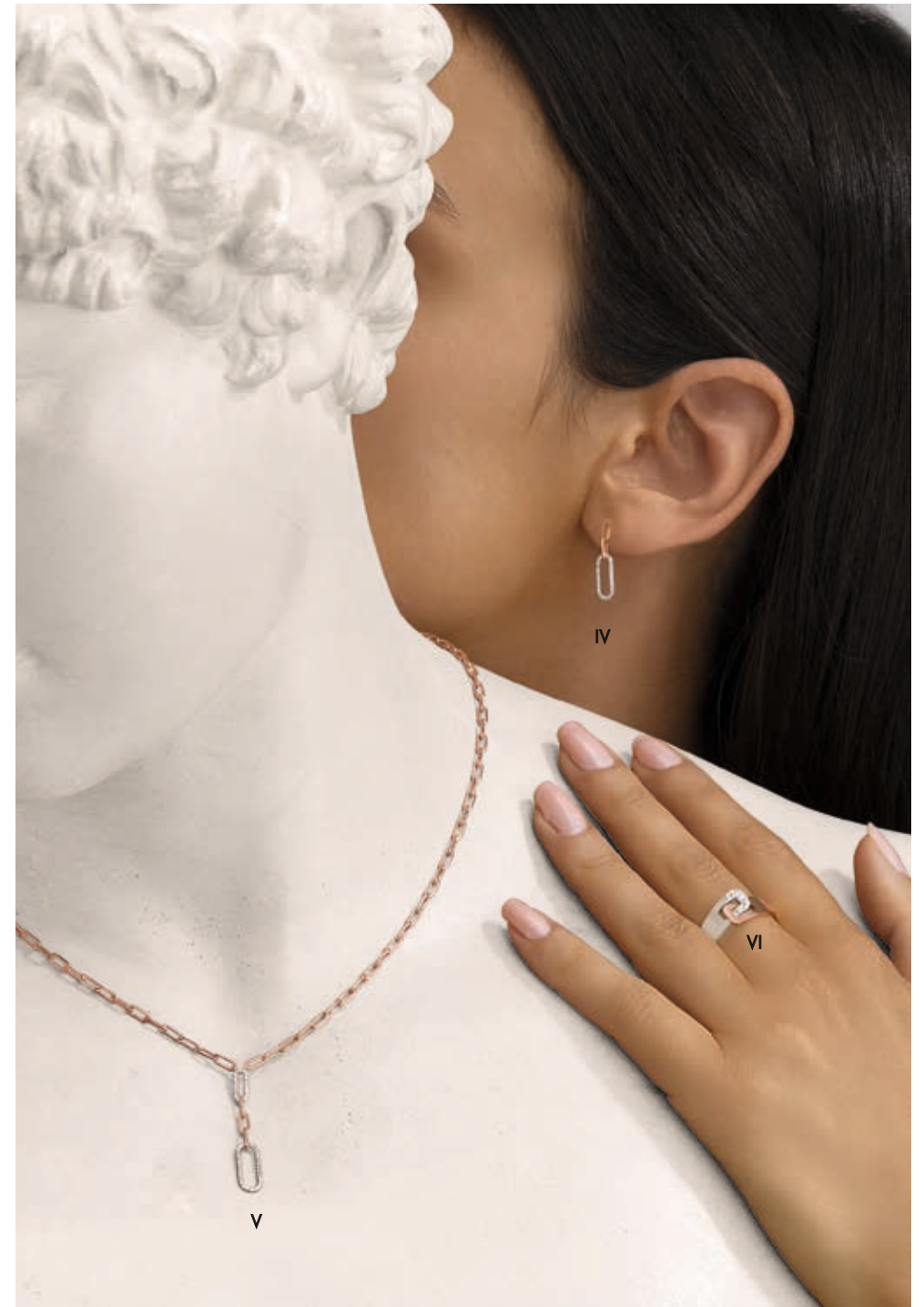
IV. Boucles d'oreilles - Diamants, or rose - 995 €/ V. Collier - Diamants, or rose - 1 790 € VI. Bague Clozeau - Diamants, or blanc, or rose - 1 280 €