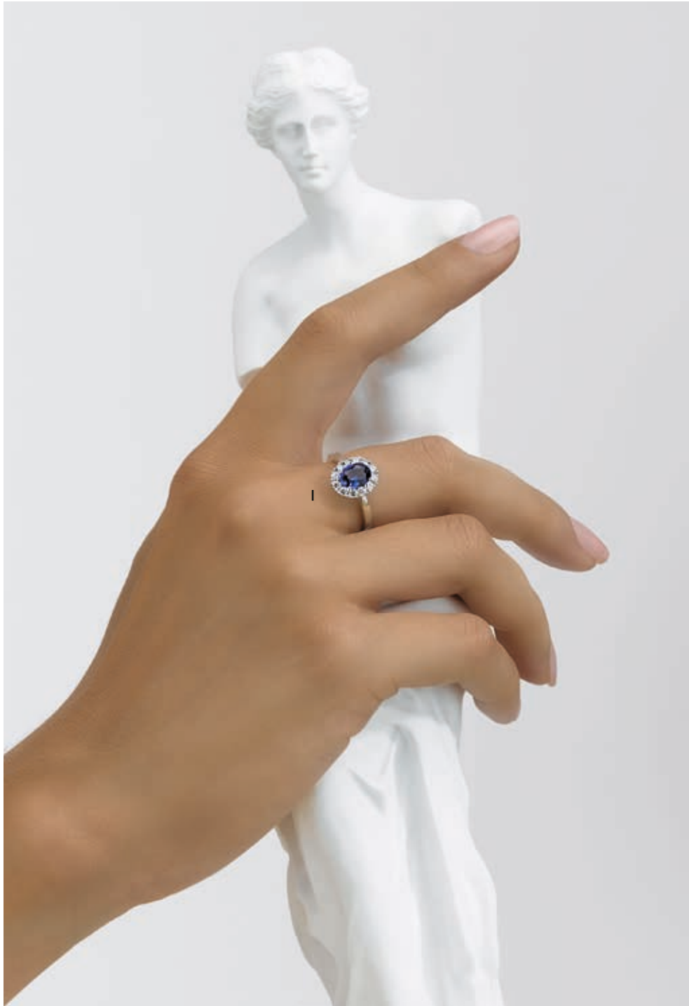
I. Bague - Diamants, saphir, or blanc - 5 190 €