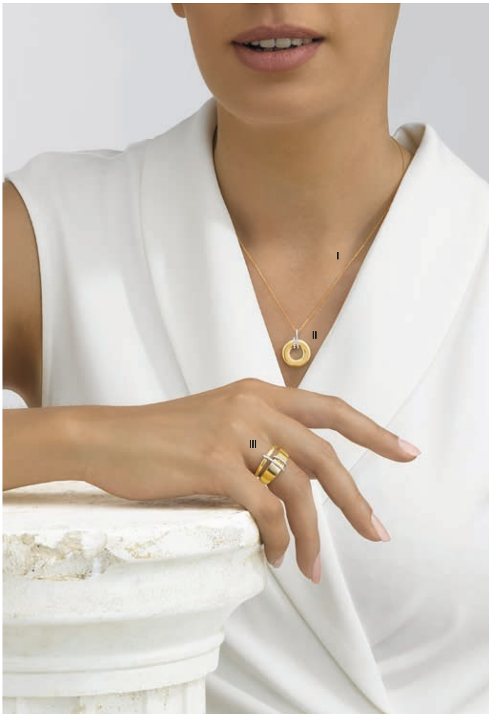
I. Chaîne forçat - Or jaune - 250 € / II. Pendentif seul - Diamants, or jaune - 1 475 € III. Bague - Diamants, or jaune - 3 050 €