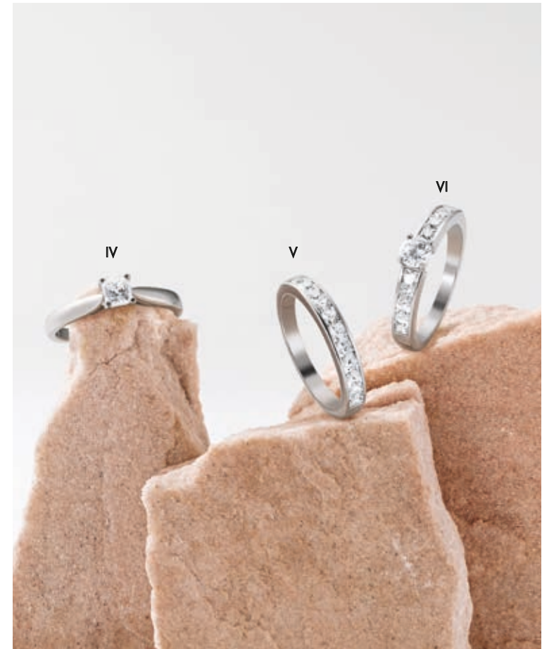
IV. Solitaire - Diamant, or blanc - 2 450 € / V. Alliance - Diamants, or blanc - 2 995 € VI. Solitaire accompagné - Diamants, or blanc- 5 395 €