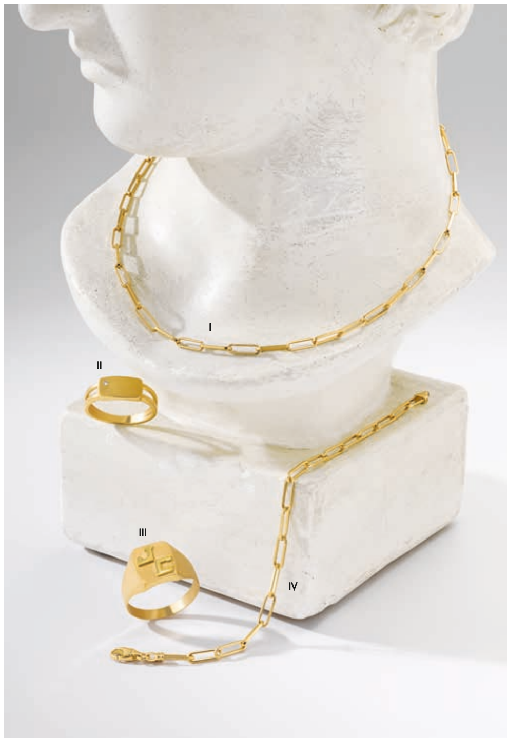
I. Collier - Or jaune - 1 750 € / II. Bague - Diamant, or jaune - 895 € III. Bague - Or jaune - 995 € / IV. Bracelet - Or jaune - 1 150 €