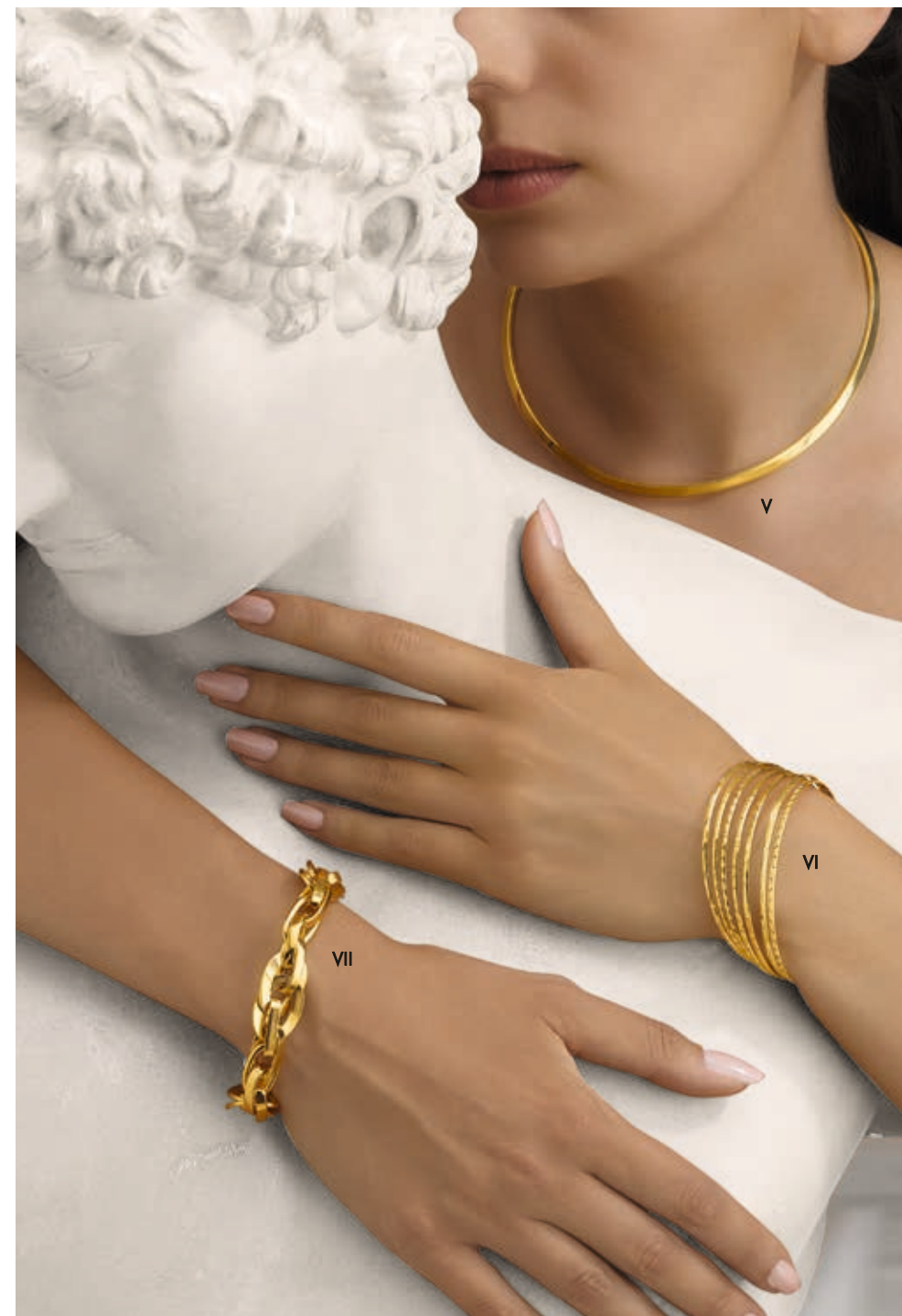
V. Collier torque - Or jaune - 2 800 € / VI. Jonc semainier - Or jaune - 4 580 € VII. Bracelet - Or jaune - 2 940 €