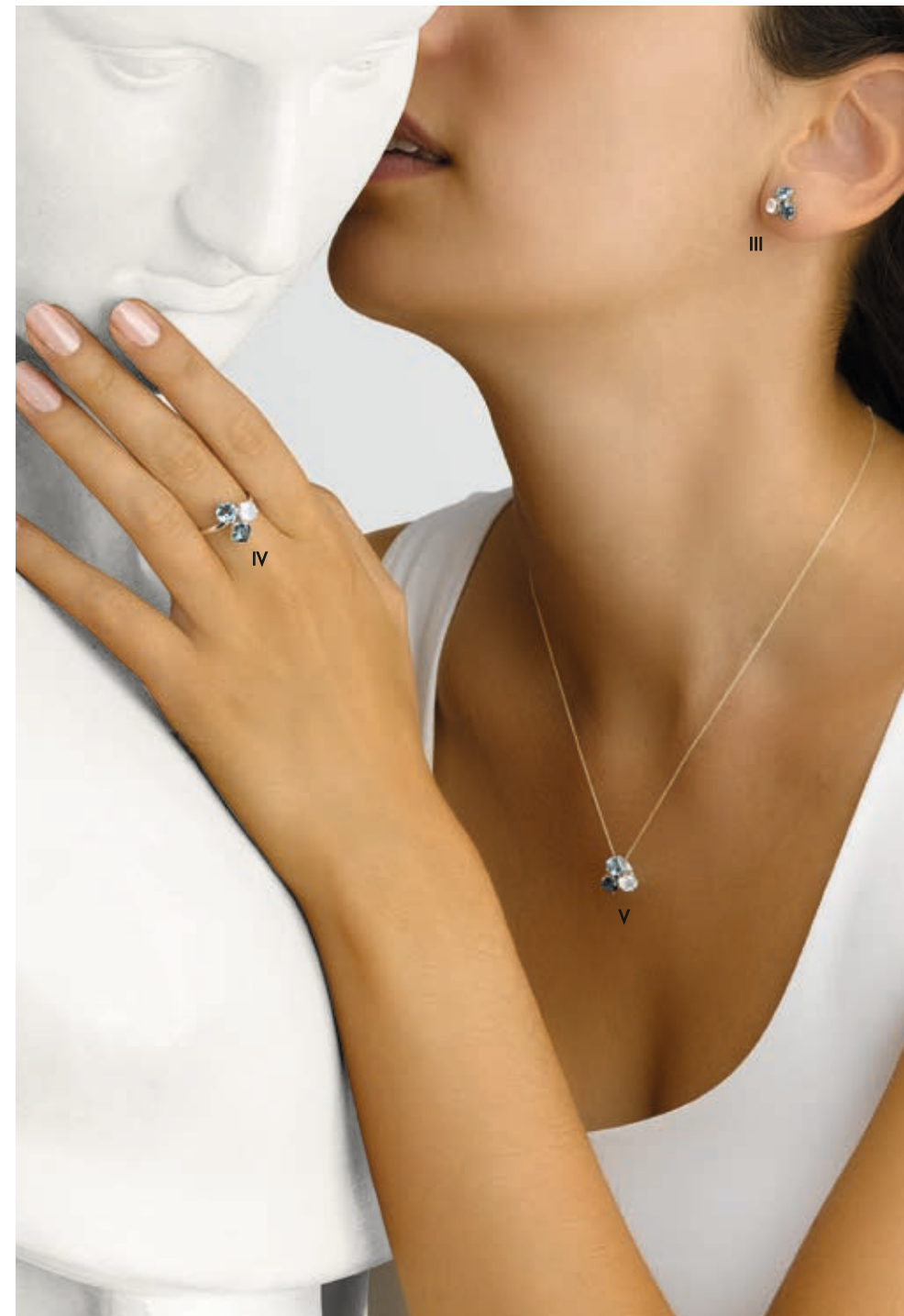
III. Boucles d'oreilles - Topaze bleue, topaze blue London, calcédoine, or blanc - 1 075 € IV. Bague - Topaze bleue, topaze blue London, calcédoine, or blanc - 1 060 € V. Collier - Topaze bleue, topaze blue London, calcédoine, or blanc - 995 €