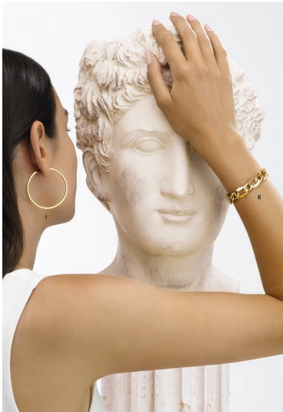
I. Créoles - Or jaune - 795 € / II. Bracelet - Or jaune, or blanc- 2 295 €