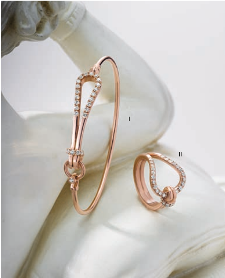
I. Bracelet - Diamants, or rose - 4 195 € / II. Bague - Diamants, or rose - 3 520 €