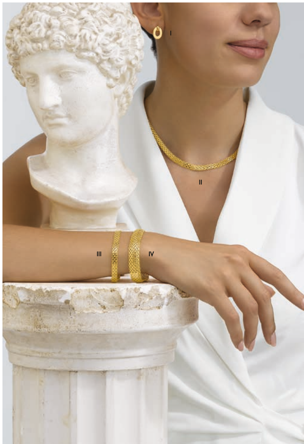
I. Boucles d'oreilles - Or jaune - 890 € / II. Collier - Or jaune - 1 595 € III. Bracelet - Or jaune - 790 € / IV. Bracelet - Or jaune - 1 630 €