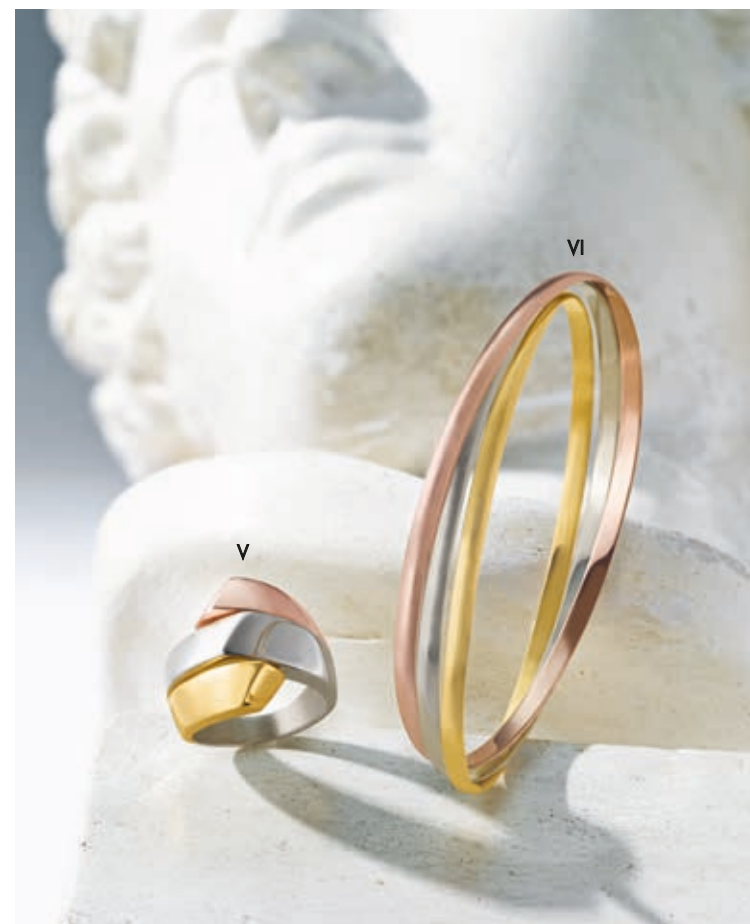
V. Bague - Or jaune, or blanc, or rose - 1 450 € / VI. Bracelet jons entrelacés - Or jaune, or blanc, or rose - 2 920 €