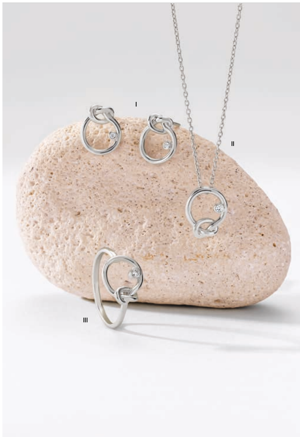
I. Boucles d'oreilles - Diamants, or blanc - 1 175 € / II. Collier - Diamant, or blanc - 1 420 € III. Bague - Diamant, or blanc - 1 090 €