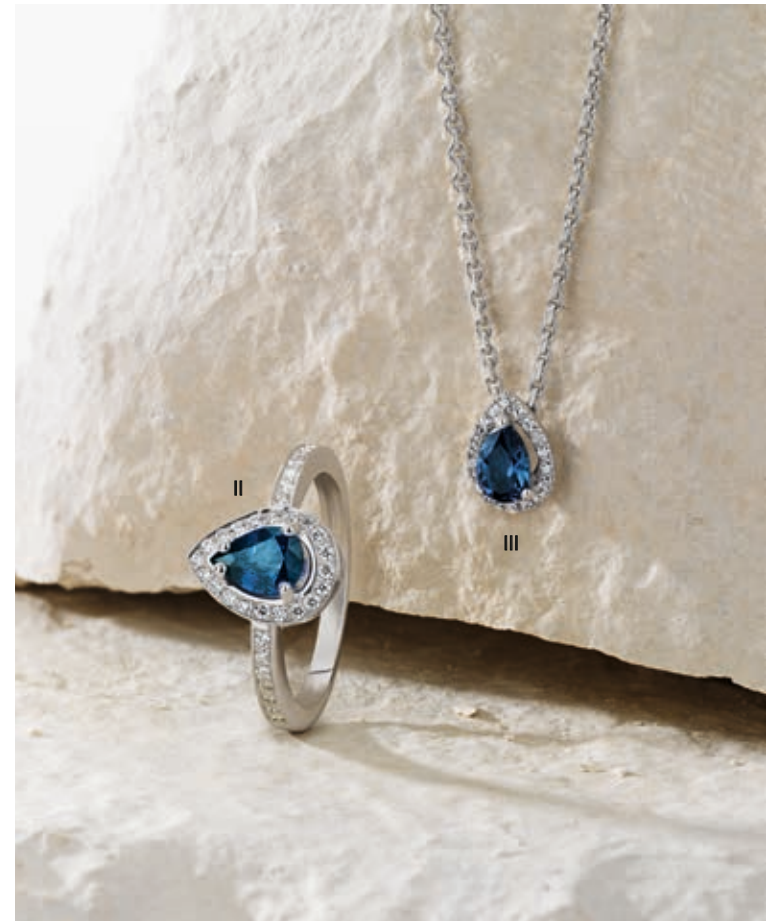
II. Bague - Diamants, saphir, or blanc - 2 530 € / III. Collier - Diamants, saphir, or blanc - 1 350 €